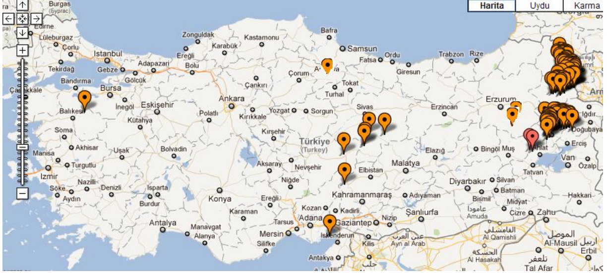
Türkiye’de Karapapak nüfusunun yoğun olduğu bölgeler.

Türkiye’de en fazla Karapapak yoğunluğu %15 ile Kars ilinde mevcuttur. Kars Merkez, Selim ve Kağızman, yoğun olarak da Arpaçay ilçelerinde bulunurlar. Ardahan ilinin Çıldır ilçesinde Karapapak nüfusu oldukça kalabalıktır. Muş’ta da Karapapak nüfusu çok fazladır. Muş Merkez ve Bulanık, Malazgirt ilçelerine yerleşmişlerdir. Ağrı’da Eleşkirt, Tutak, Taşlıçay ilçelerinde varlıklarını sürdürürler. Erzurum ilinde merkezde ve Horasan ilçesinde yaşayan Karapapaklar da vardır. Bu illerin haricinde Sivas, Amasya, Adana, Balıkesir, Bursa, Kayseri’de de Karapapaklar yaşamaktadır.