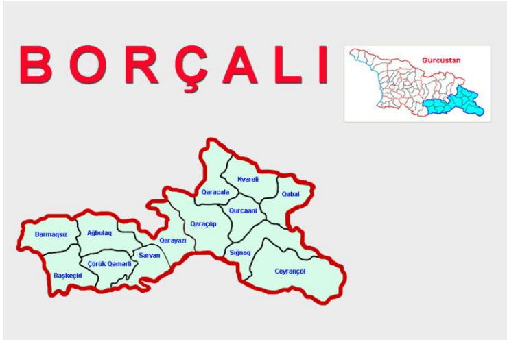
Gürcistan’da Karapapakların yaşadığı Borçalı Bölgesi

Türkiye’de en fazla Karapapak yoğunluğu %15 ile Kars ilinde mevcuttur. Kars Merkez, Selim ve Kağızman, yoğun olarak da Arpaçay ilçelerinde bulunurlar. Ardahan ilinin Çıldır ilçesinde Karapapak nüfusu oldukça kalabalıktır. Muş’ta da Karapapak nüfusu çok fazladır. Muş Merkez ve Bulanık, Malazgirt ilçelerine yerleşmişlerdir. Ağrı’da Eleşkirt, Tutak, Taşlıçay ilçelerinde varlıklarını sürdürürler. Erzurum ilinde merkezde ve Horasan ilçesinde yaşayan Karapapaklar da vardır. Bu illerin haricinde Sivas, Amasya, Adana, Balıkesir, Bursa, Kayseri’de de Karapapaklar yaşamaktadır.